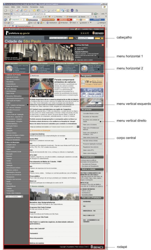
Figura 3 – Site oficial da cidade de São Paulo. Disponível em: <http://www.capital.es.gov.br>. Acesso em 11 jun. 2007. Fonte: Braida (2007, p.116).

Na análise estrutural do site oficial da cidade de São Paulo procuramos identificar, basicamente, quatro partes: cabeçalho, corpo central, rodapé e menus. Em decorrência da análise, encontramos um cabeçalho, dois menus horizontais, dois menus verticais (um localizado à direita do corpo principal e o outro, à esquerda), um corpo central e um rodapé. Esta mesma sintaxe está presente em vários outros sites oficiais das cidades brasileiras.